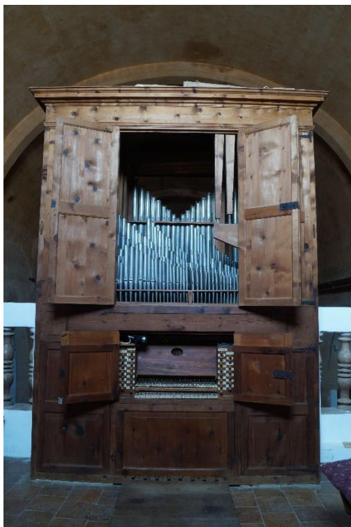
Foto 09: aquest petit orgue històric és considerat un dels millors de Mallorca.