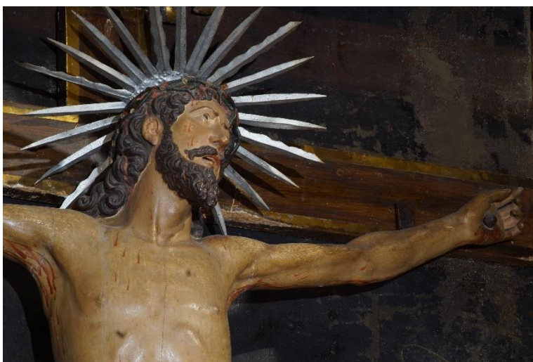
Foto 10: En la capella més fonda de totes hi ha un retaule de principis del s XVIII sense daurar, amb aquest interessant Crist agonitzant.