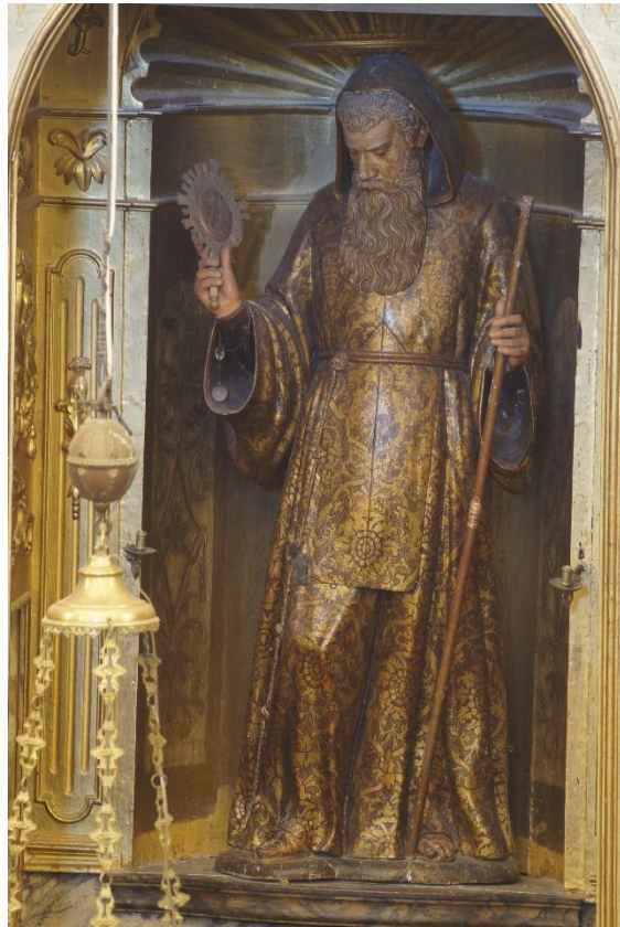
Foto 07: Imatge del s XVII, el fundador dels mínims, Sant Francesc de Paula. Dona nom al convent, i se'l representa portant, a modo de custòdia, l'emblema de l'ordre "CHARITAS". El carisma de l'ordre era la caritat, la humiliat i la penitència.