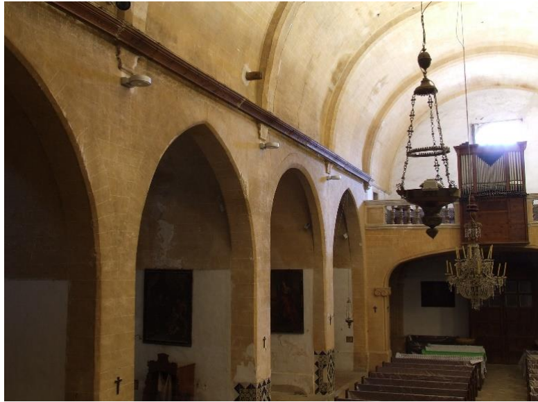
Foto 04: la seva arquitectura ens sorprèn per la seva falta d'elements ornamentals que ens refereixin la tradició culte del Renaixement: no hi ha pilastres adossades entre capelles. A la nau l'entaulament desapareix a favor d'una senzilla motllura, per cert, oculta per una barra de fusta que recorre tota la nau. Sobre el cor alt hi trobam el petit orgue.