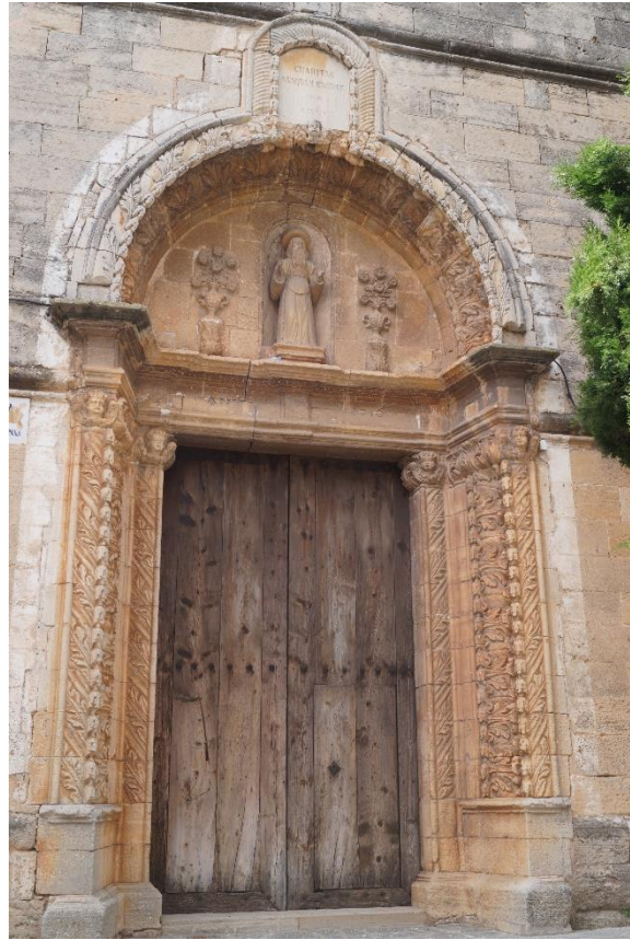
Foto 01: El portal en forma de nínxol (du la data de 1716) és molt arcaïtzant, amb poca diversitat ornamental, revestit amb fulles d'acant.