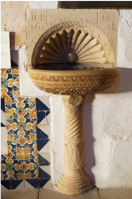
Foto 13: Pica d'aigua en el portal lateral (datada el 1648), amb ornamentació renaixentista: la llegenda en semicercle diu "Septie in die cedit iustus", extret de Proverbis 24,16, que vol dir: "El just, ni que caigui set vegades, s'aixecarà".