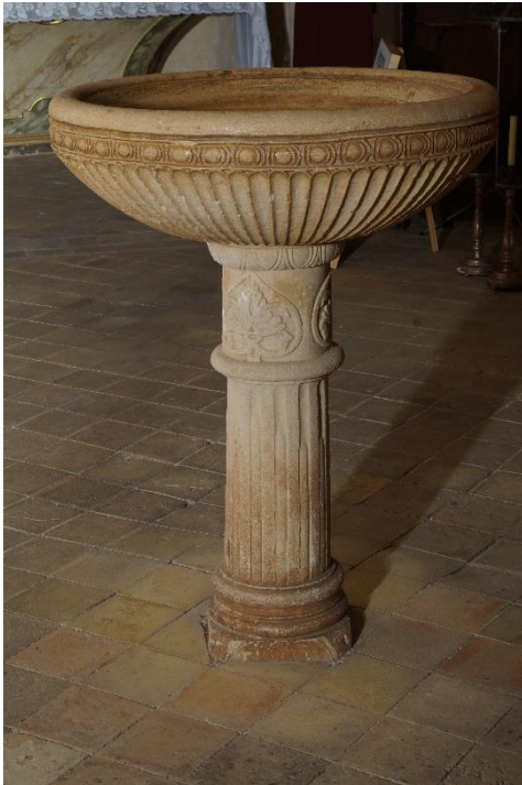
Foto 02: Pica d'aigua a l'entrada del temple, amb ornamentació renaixentista