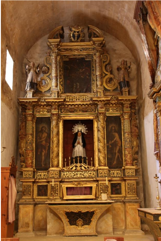
Foto 11: Com tota església mínima té una capella dedicada a la Mare de Déu de la Soledat, una devoció específica de l'ordre. La majoria de convents mínims estan dedicats a aquesta o a St Francesc de Paula.