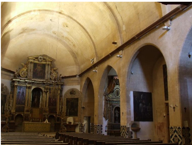
Foto 03: l'extrema austeritat de l'interior ens dona la impressió d'una cova. Tot i que no es tracta d'un edifici construït en distintes etapes estilístiques, hi trobam sorprenentment arcs ogivals, una mostra més del seu arcaisme.

Foto 02: Pica d'aigua a l'entrada del temple, amb ornamentació renaixentista