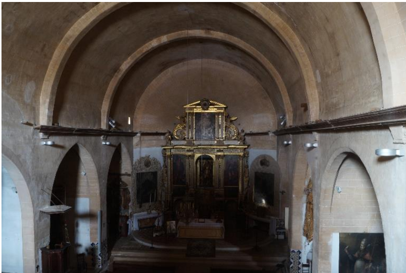
Foto 05: el presbiteri és trapezoïdal, amb volta tronco-cònica (fórmula habitual a Mallorca i Menorca en el s XVII, i encara en el s XVIII), però pel fet de ser el que té els murs més convergents de totes les Balears, i donada la presència del retaule, ens pot semblar que és de planta triangular i de volta cònica.